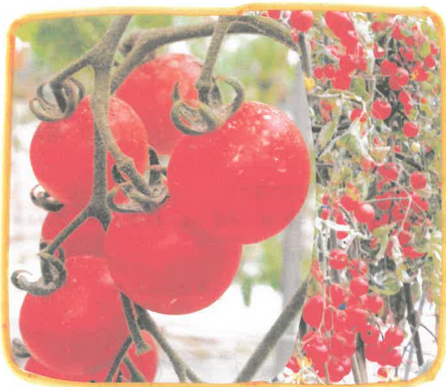
／岡部ハウス内、3月30日（須賀川市仁井田）

アスパロの味と香りが、トマトと同じように濃縮されます。「SPSB」(ストロング光合成細菌)は、悪天候でも光合成が約500倍も加速されて、成長を進めます。同時に「肥料体系も作られます。この二つの要素を、成長に応じて使っています。