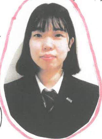
(福島高校 2年) 二本松市