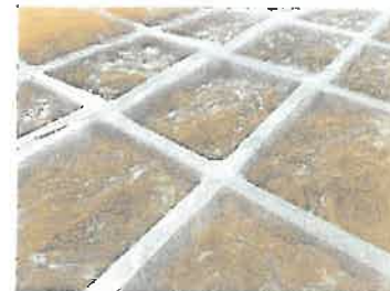
あめ色でキラキラ光っています

工場では職人さんがキラキラ光るところてんを突き棒で突き、パック詰めしていました。あいコープでも扱う私市醸造の米酢を保存液として詰めます。まんま通信に合わせて製造し、あいコープで終売となればその年の製造は終わり(今年9月中旬まで)。まさに、あいコープのためのところてんです。是非食べ続けたいですね。