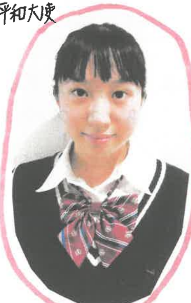
(福島高校 1年) 福島市