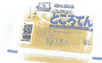
ところてん 300g 148円(税抜き)