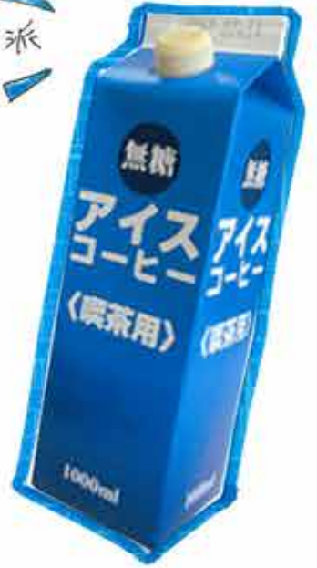
000743 粉 100g 000744 豆 626円(税込)