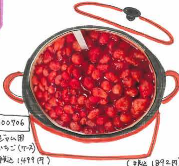
000706 ジャム用 いちご(7-ス) (税込 1,499円)