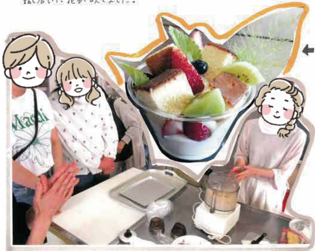
豆腐クリームは豆腐まるごとの様な栄養がたっぷり!!

「私のあいコープライフは... 出会いから お気に入りまで...」 仲間だなあ～