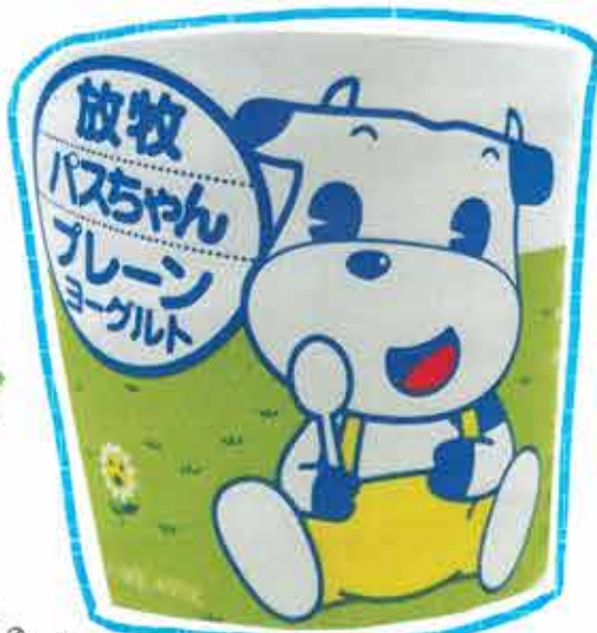
② パスちゃんプレーンヨーグルト

パスちゃんヨーグルトで作るアイスは、どこでも大人気。ヨーグルトそのものがクリーミーで甘みがあります。東京ドーム38個分以上の広さでストレスなく放牧された牛の生乳100%のヨーグルトだからです。