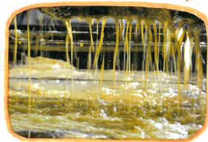
圧力で搾られている菜種