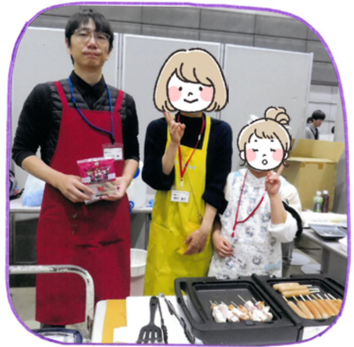
鎌倉ハムクラウン商会 火焼きたての串刺し フランクフルトが好評!

石けんコーナーのサポーターをしまいぬってやりました。スライプをおすがかりでした。つかれたけどたのしかった。