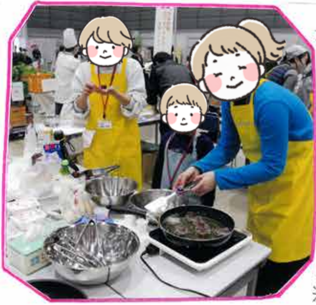
まつり当日の様子