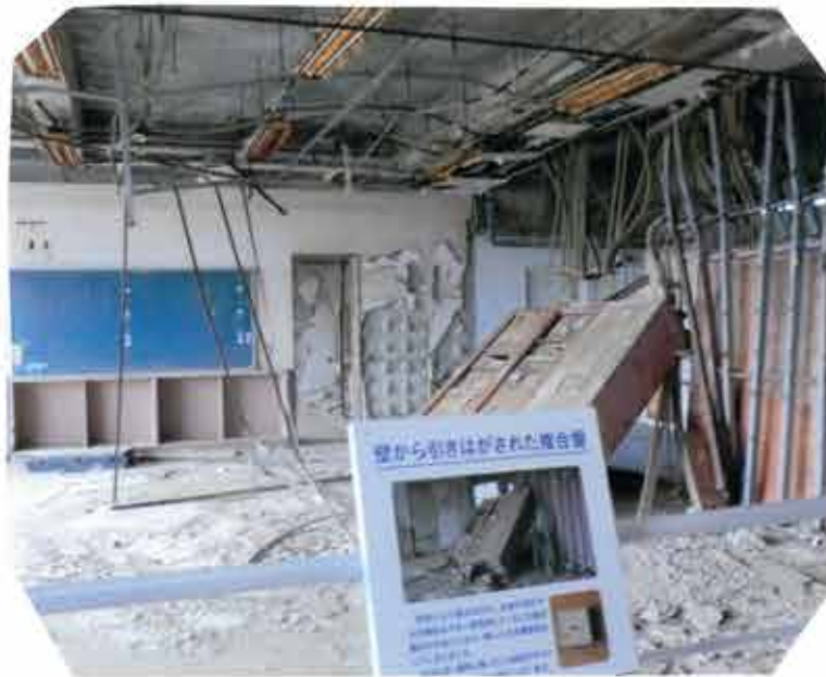
② 請戸小学校 津波被害がそのままだけされている

未来に語りつぎ、二度と事故を起こしてはいけぬ。このふくしまが最後だった、といえる未来を作ってほしいと願います。今年、2025年3月24日(月)にも14年目の今を学ぶ親子ツアーを開催し、大震災と原発事故の被害を学び合い、平和について考えていきます。(後日チラシを配布します)