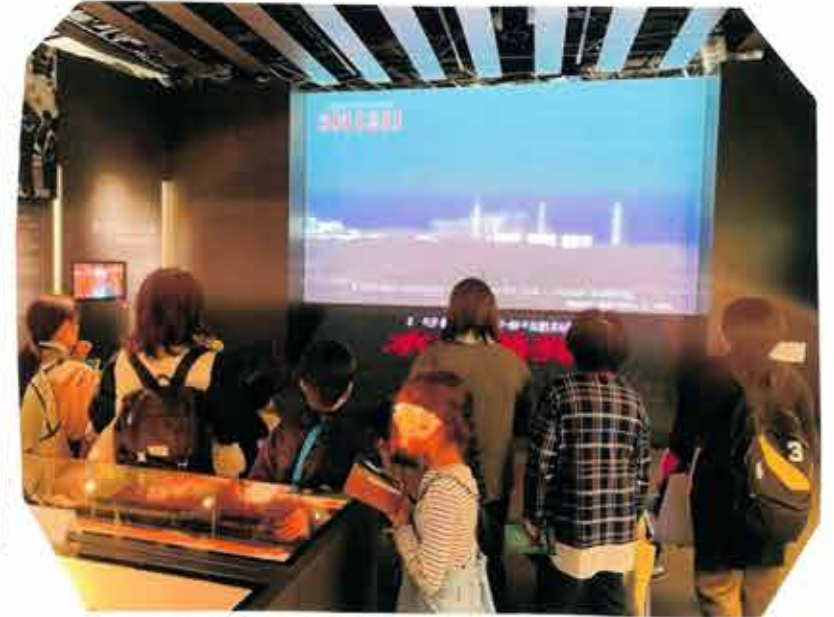
伝承館で2011年3月11日タイムスリップ